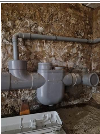
Photo n° PhAss002 Localisation : Eau Usée Description : Type de raccordement : Siphon disconnecteur