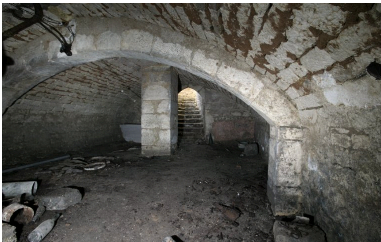
Sous-sol situé sous l'aile sud.