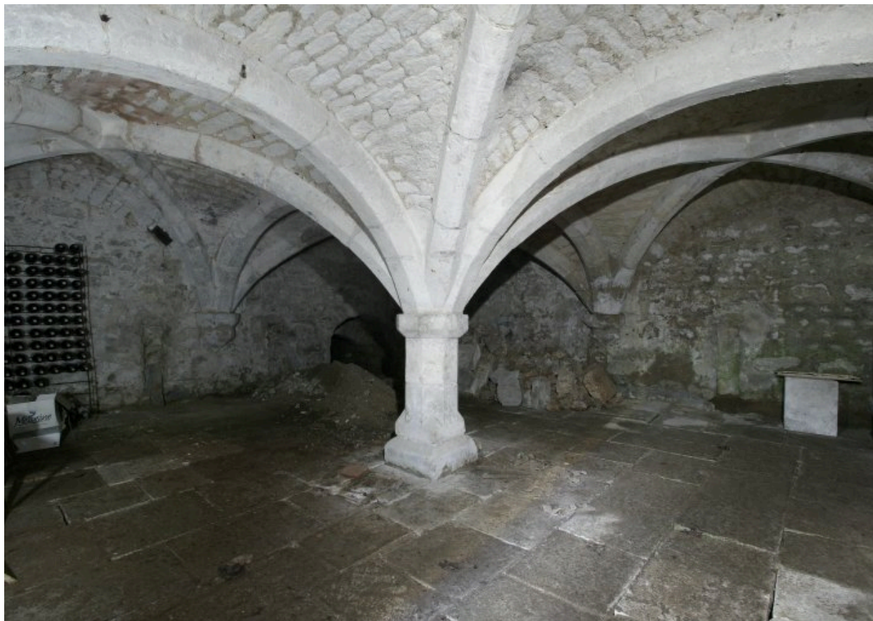
Sous-sol situé sous le bâtiment en fond de cour.