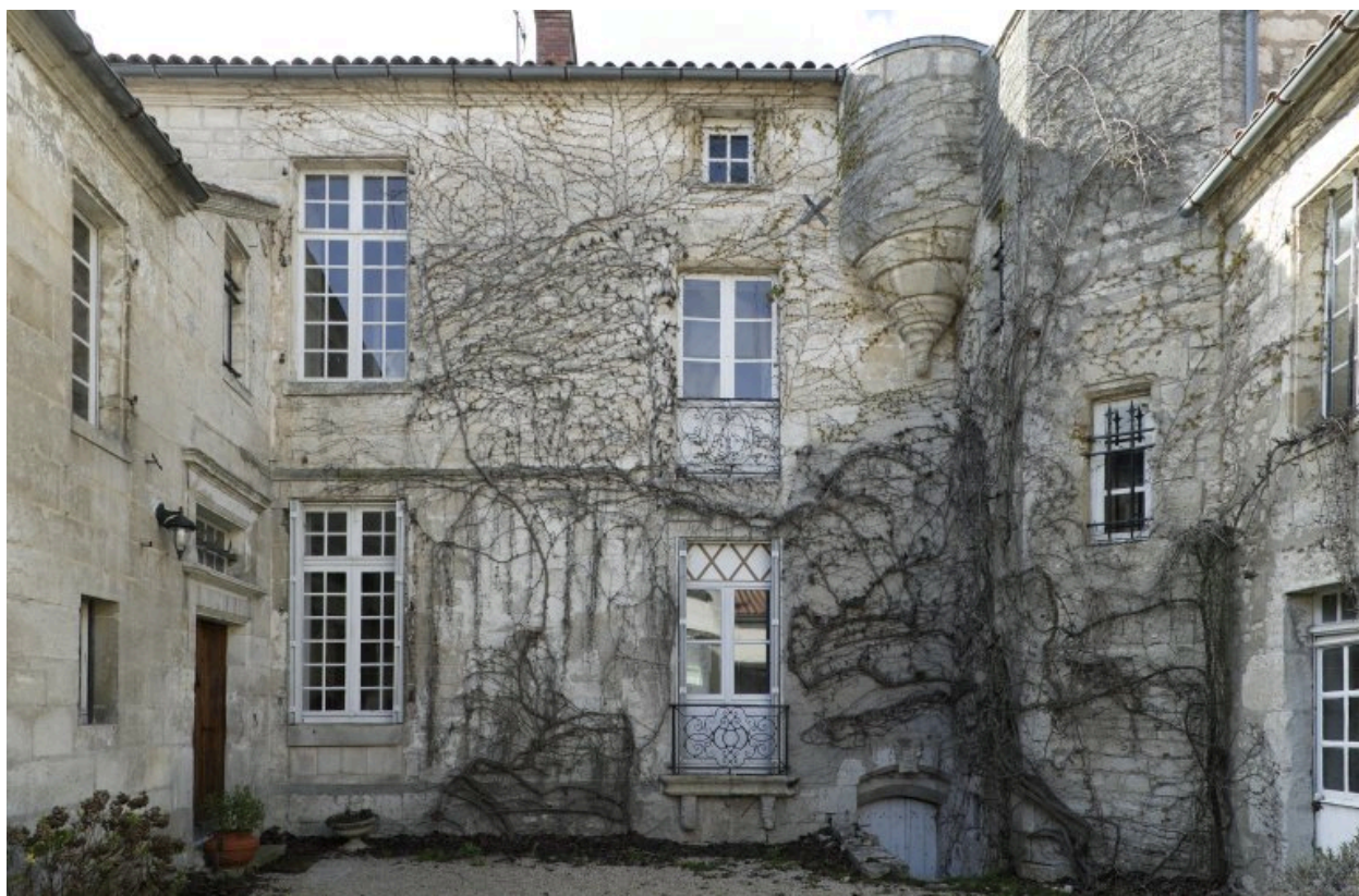
Vue d'ensemble prise de la rue du Port.