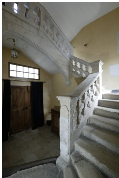
Vue d'ensemble de l'escalier, situé dans l'aile sud.