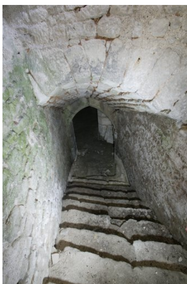
Escalier de descente au sous-sol situé sous l'aile sud.