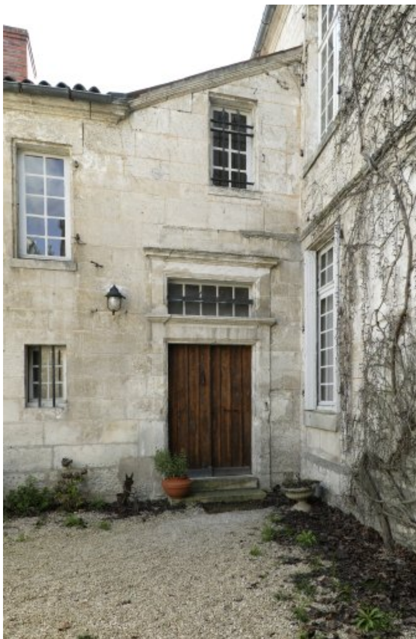
Aile sud (du XVIII e siècle), le long de la rue de l'Hôpital. Vue prise de la cour.