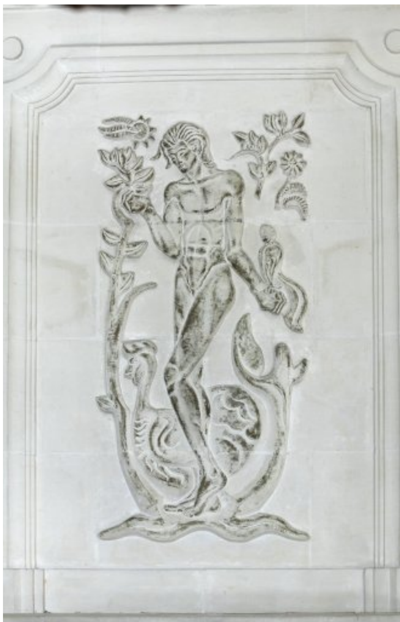
Trumeau de la cheminée de la fig. précédente, signée et datée Albert Deman, 1948.