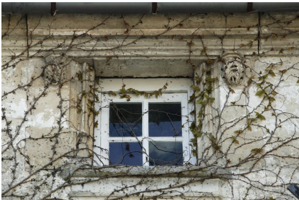
Fenêtre du XVe siècle au niveau de comble du bâtiment en fond de cour.