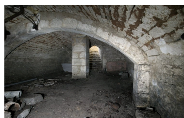
Sous-sol situé sous l'aile sud.