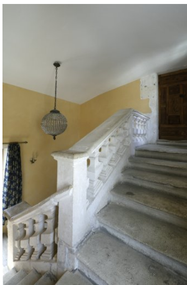
Dernière volée de l'escalier.