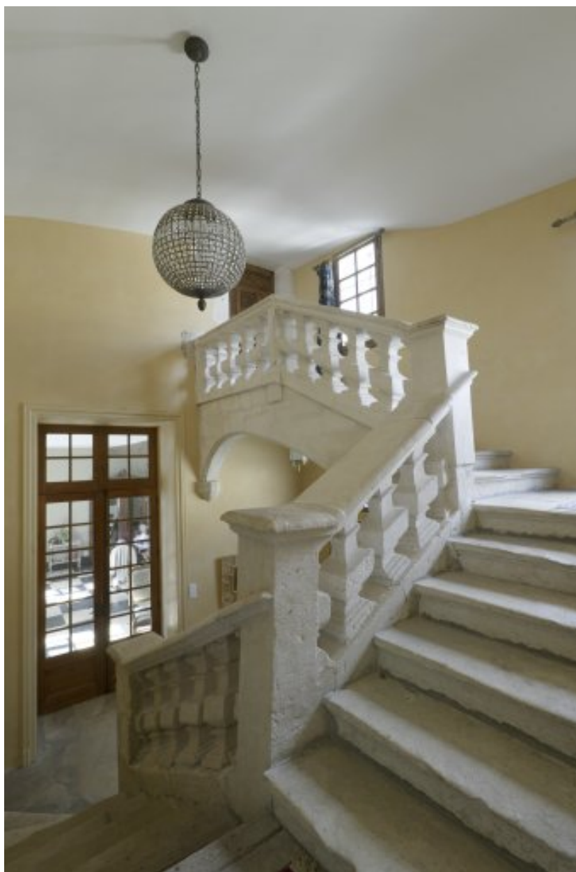
Vue d'ensemble de l'escalier.