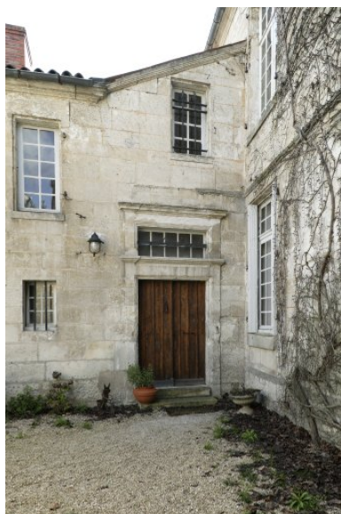
Aile sud (du XVIIe siècle), le long de la rue de l'Hôpital. Vue prise de la cour. IVR52_20078500079NUCA