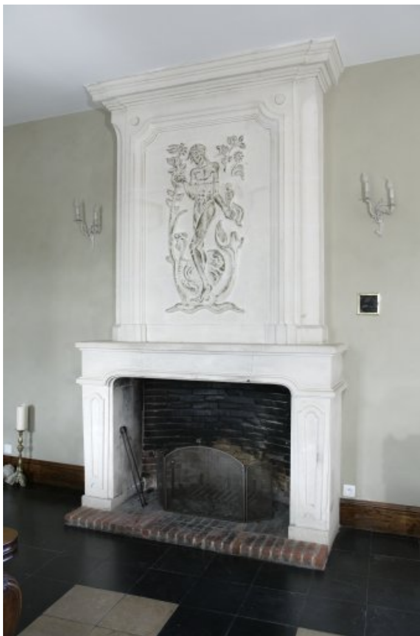
Cheminée moderne de la pièce la plus au sud, au rez-de-chaussée du bâtiment en fond de cour.