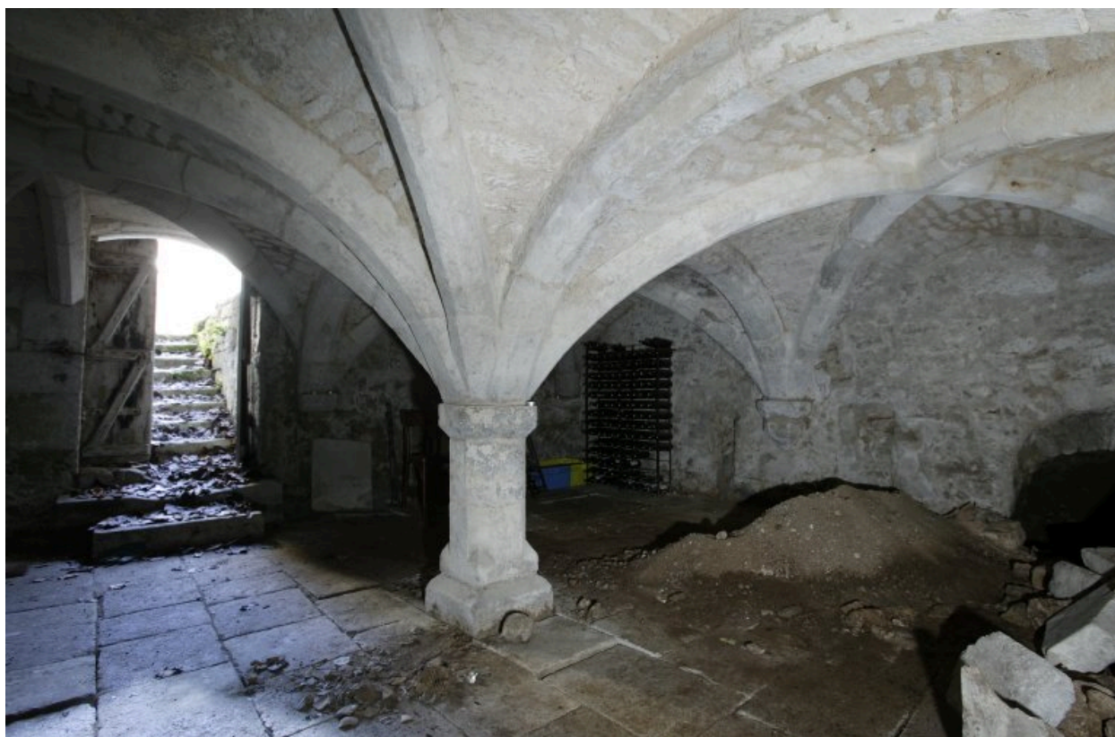
Sous-sol situé sous le bâtiment en fond de cour.