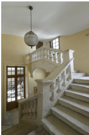
Vue d'ensemble de l'escalier.