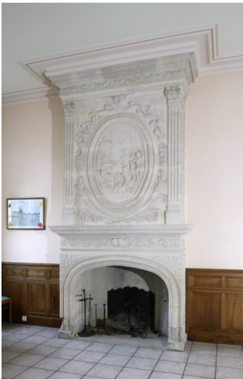
Cheminée actuellement à l'hôpital, censée provenir de l'hôtel.