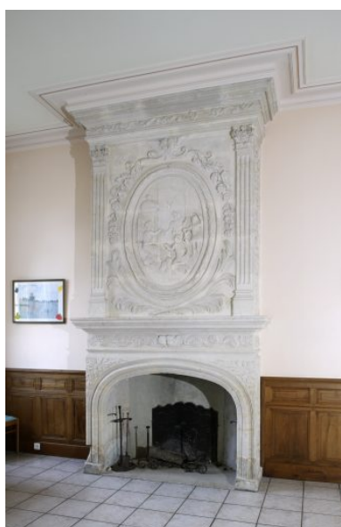
Cheminée actuellement à l'hôpital, censée provenir de l'hôtel.