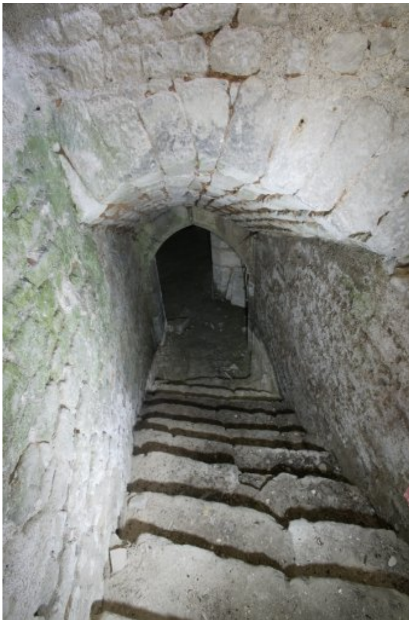
Escalier de descente au sous-sol situé sous l'aile sud.