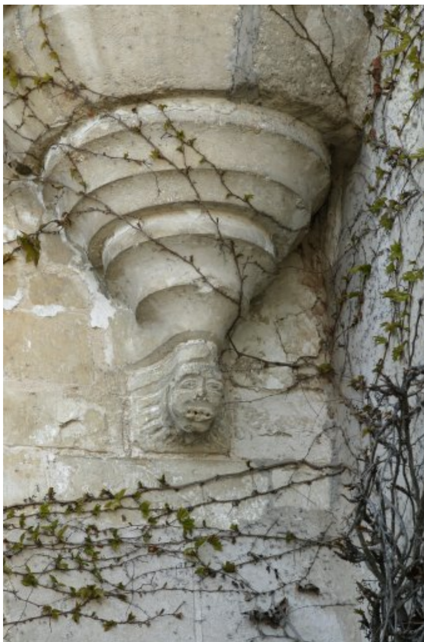
Base de la tourelle en encorbellement (ancienne vis de comble). La tête d'homme a sans doute été sculptée par Albert Deman en 1948.