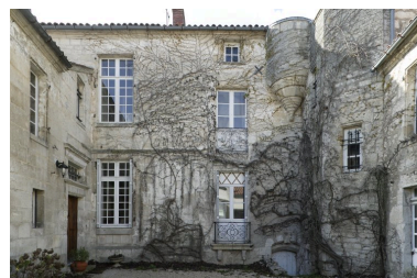
Vue d'ensemble prise de la rue du Port. IVR52_20078500080NUCA