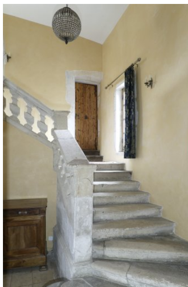
Première volée de l'escalier.