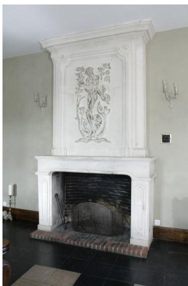
Cheminée moderne de la pièce la plus au sud, au rez-de-chaussée du bâtiment en fond de cour.