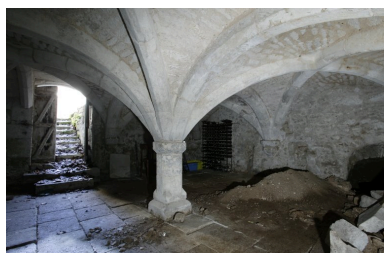
Sous-sol situé sous le bâtiment en fond de cour. IVR52_20078500071NUCA