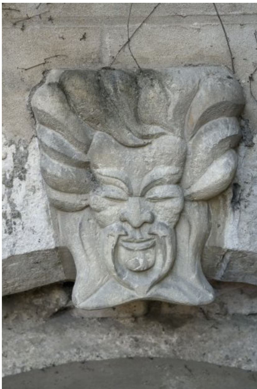
Mascaron moderne, sculpté par Albert Deman en 1948, au-dessus de la porte du sous-sol, à l'angle du bâtiment en fond de cour et de l'aile nord.