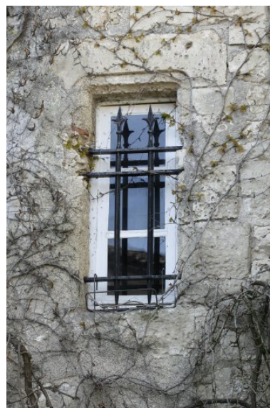
Fenêtre du XVe siècle, éclairant l'escalier en vis à l'origine et, actuellement, l'une des pièces de l'aile nord.