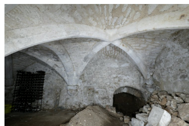
Sous-sol situé sous le bâtiment en fond de cour. IVR52_20078500072NUCA