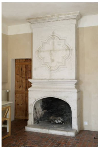
Cheminée d'une pièce au premier étage de l'aile sud. IVR52_20078500066NUCA