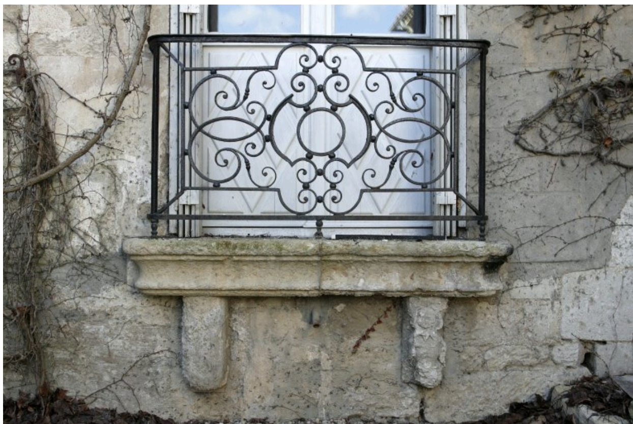
Appui de fenêtre et garde-corps, au rez-de-chaussée du bâtiment en fond de cour.