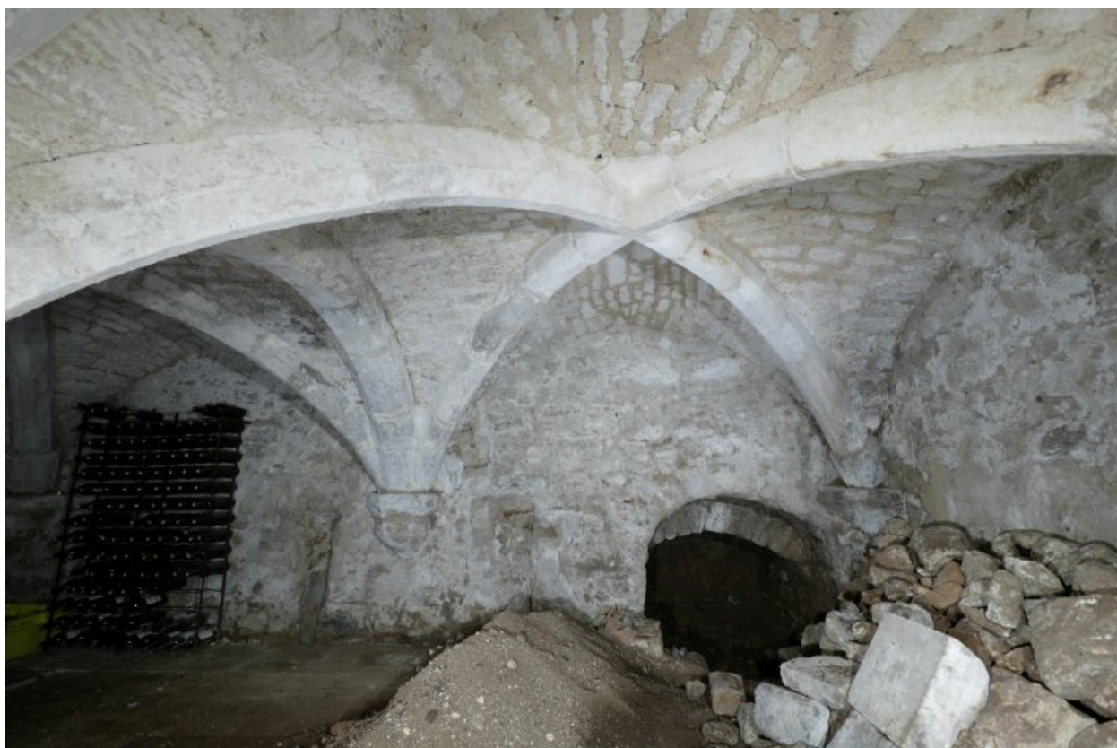
Sous-sol situé sous le bâtiment en fond de cour.