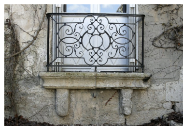
Appui de fenêtre et garde-corps, au rez-de-chaussée du bâtiment en fond de cour. IVR52_20078500074NUCA