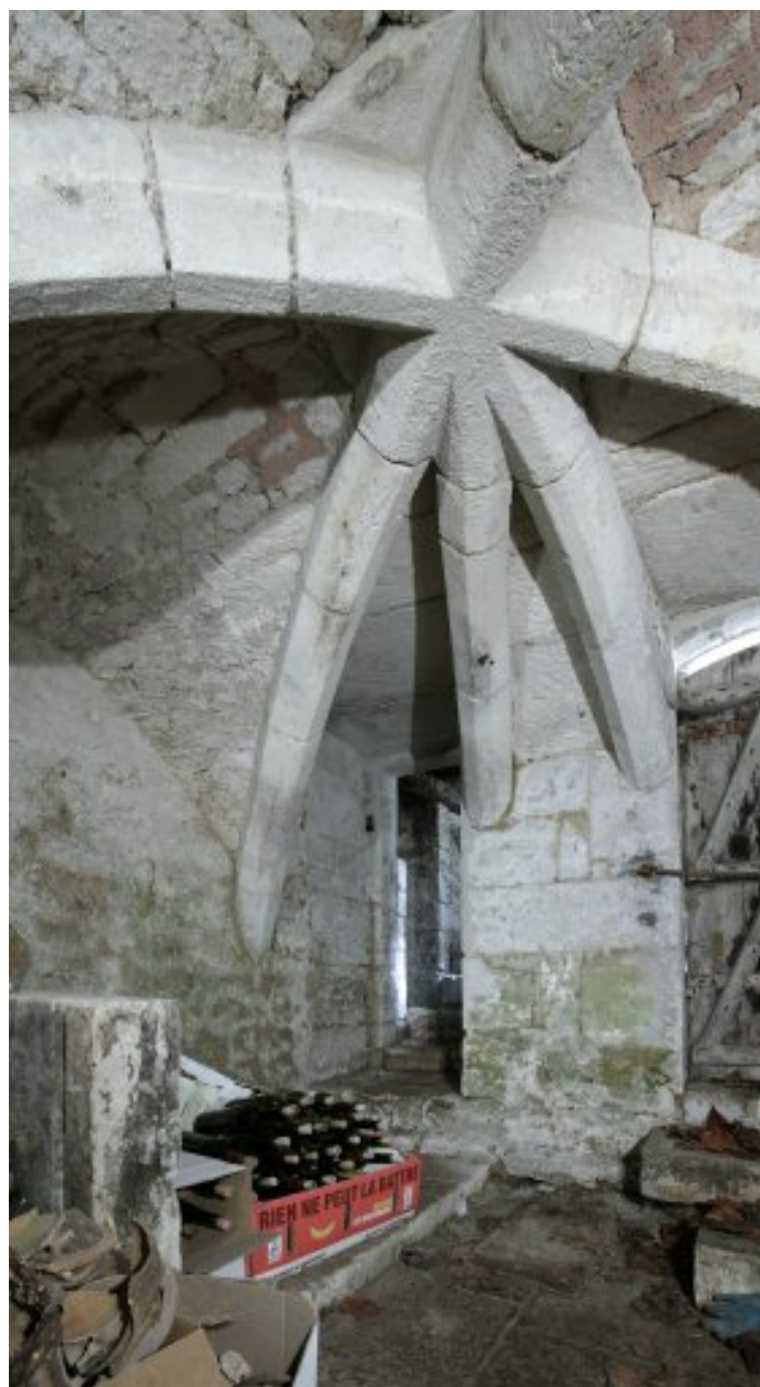
Sous-sol situé sous le bâtiment en fond de cour (vue prise en direction de l'ancien escalier en vis).