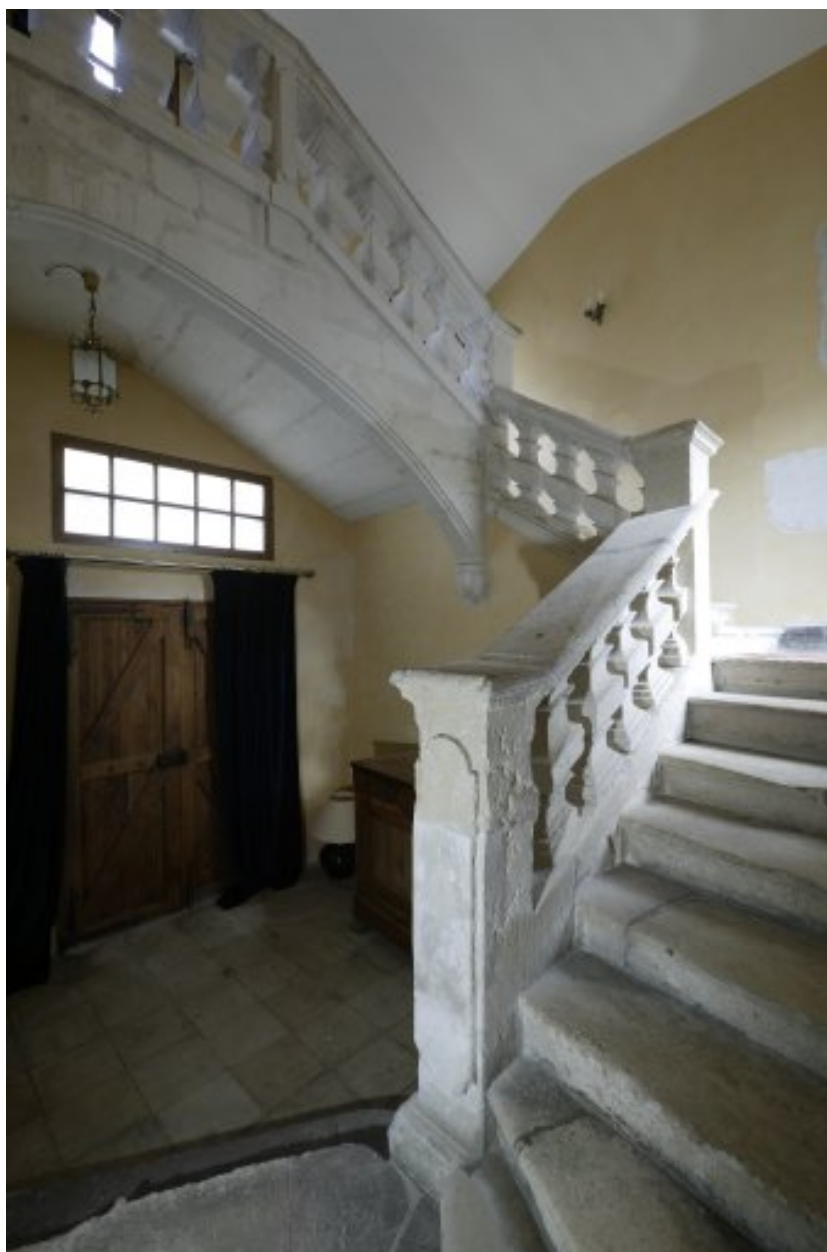
Vue d'ensemble de l'escalier, situé dans l'aile sud.