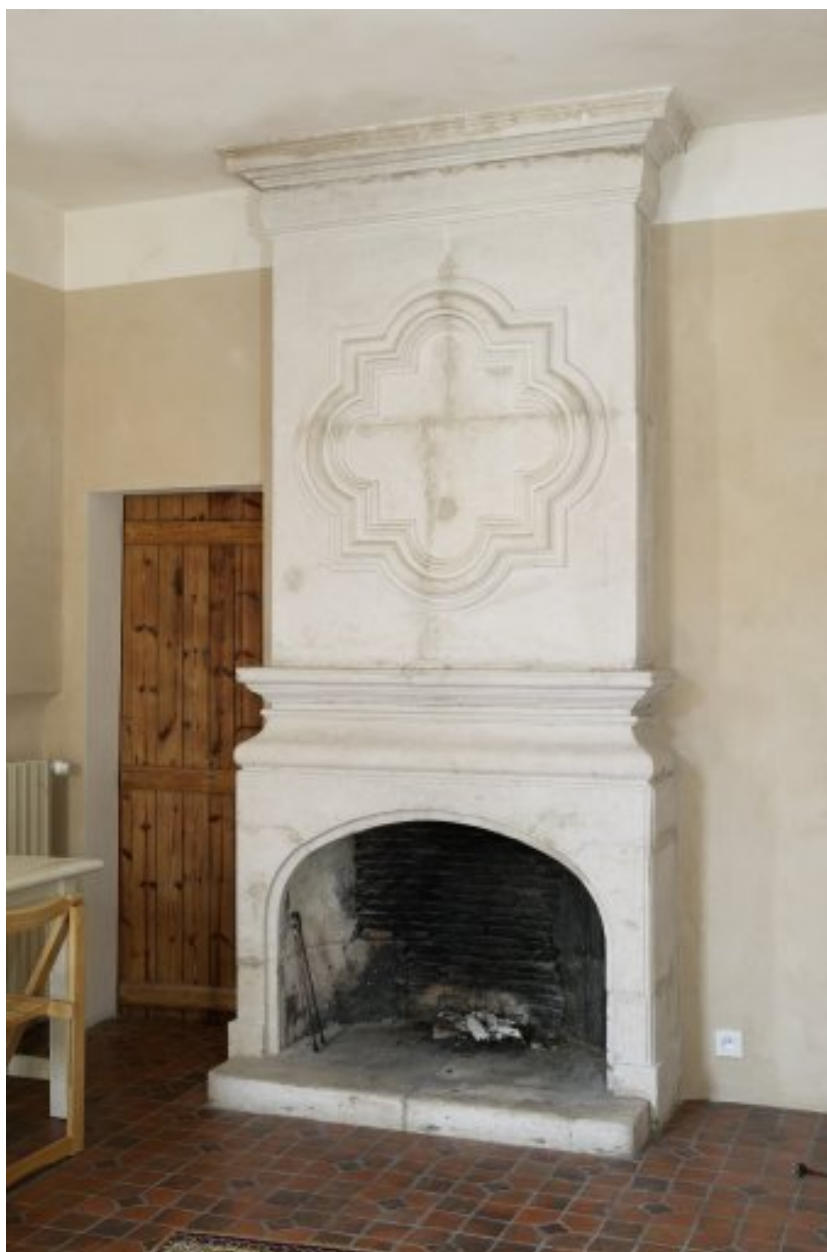
Cheminée d'une pièce au premier étage de l'aile sud.