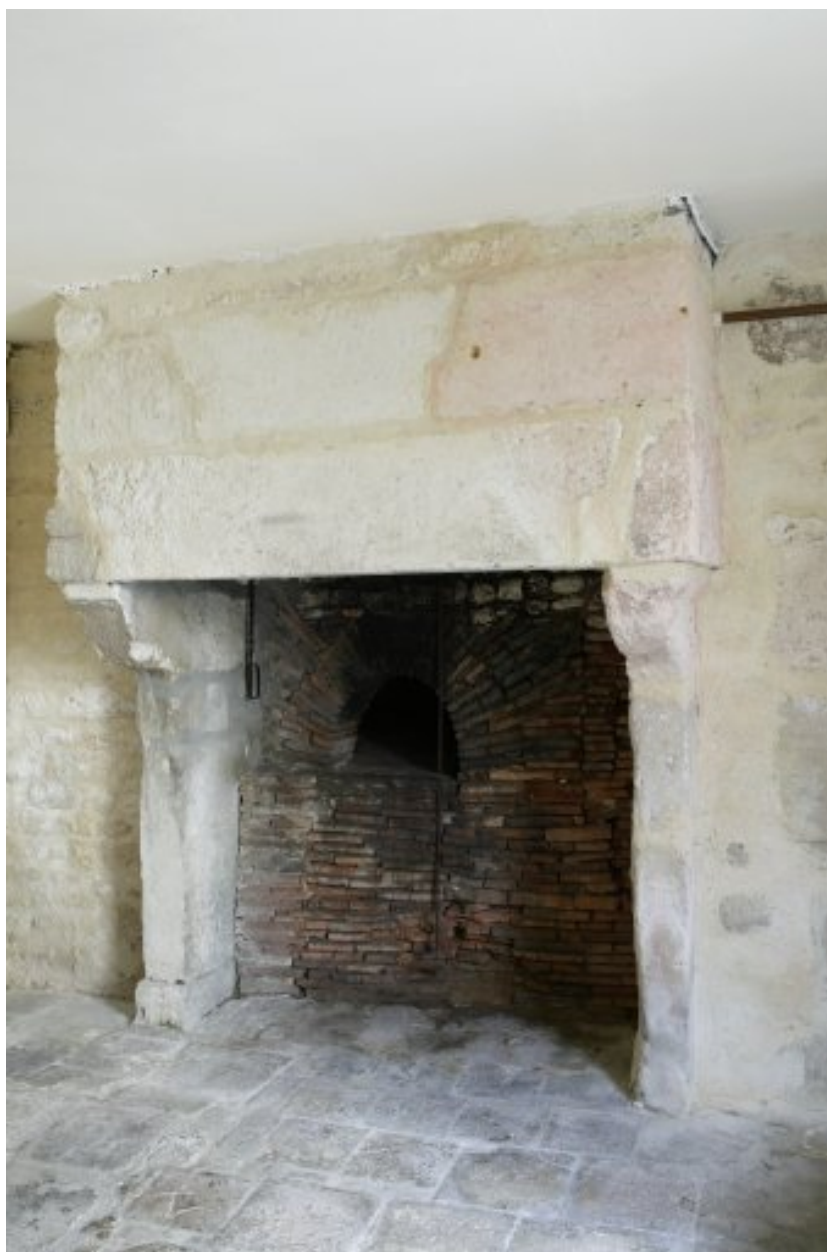
Cheminée de la cuisine, au rez-de-chaussée de l'aile sud.