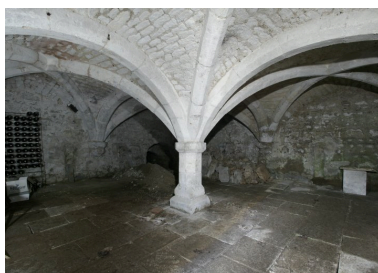
Sous-sol situé sous le bâtiment en fond de cour.