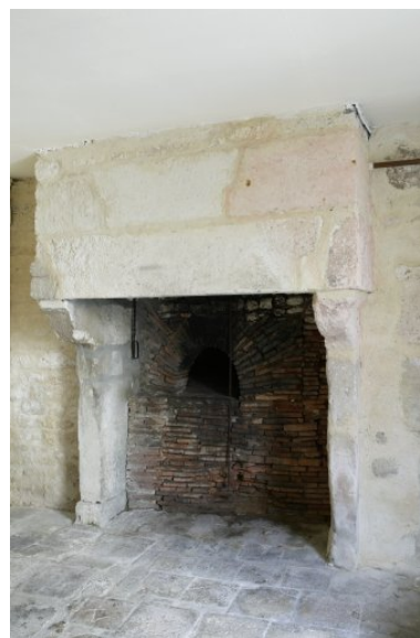
Cheminée de la cuisine, au rez-de-chaussée de l'aile sud.