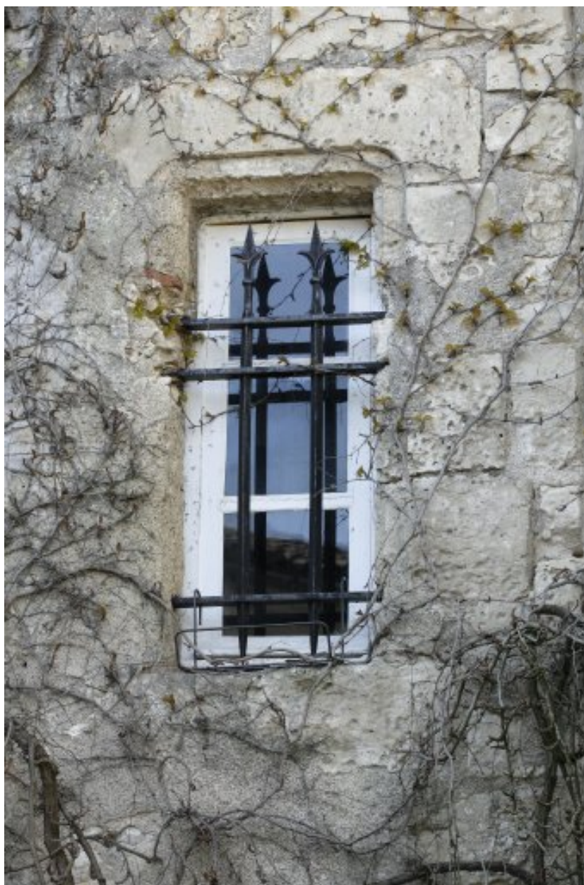
Fenêtre du XVe siècle, éclairant l'escalier en vis à l'origine et, actuellement, l'une des pièces de l'aile nord.