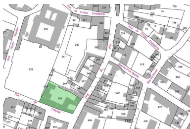
L'hôtel sur le plan cadastral actuel.