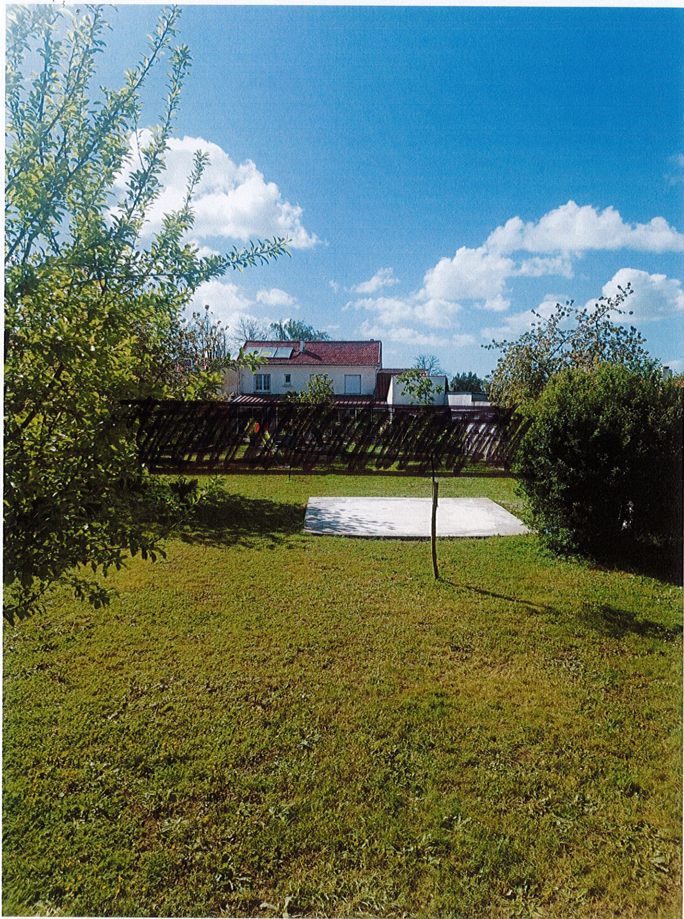
Vue N°2 après