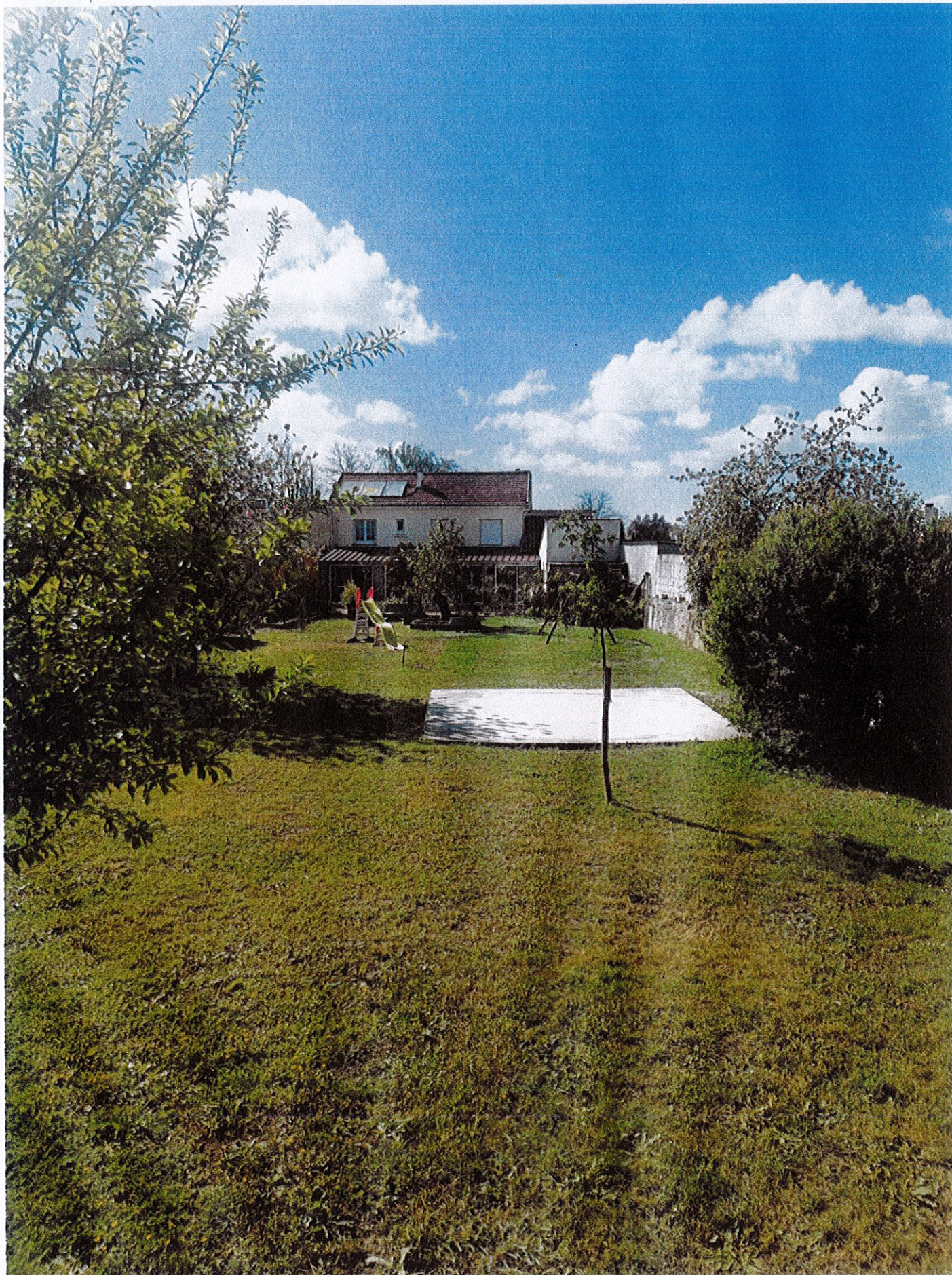
Vue N° 2 avant