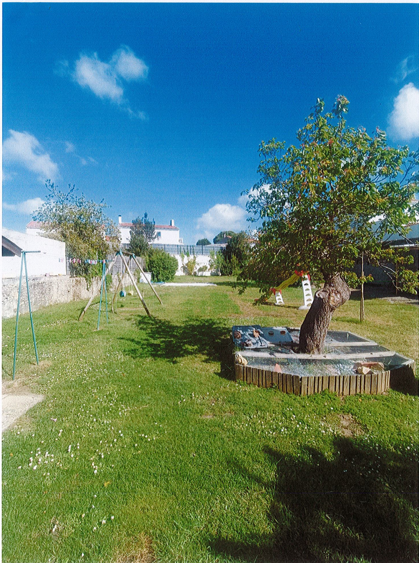
Vue N°1 avant