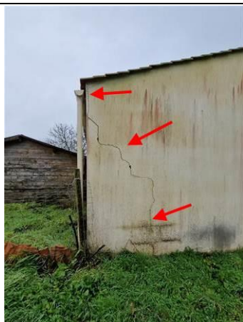
PHOTO N° PHTER003 LOCALISATION : ENDUIT MURS EXTÉRIEUR OUVRAGE : MURS EST.SUD.OUEST INFORMATIONS COMPLÉMENTAIRES : PRÉSENCE DE FISSURES SUR MURS ET ENDUITS EXTÉRIEUR