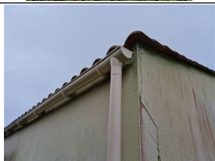
PHOTO N° PHTER003 LOCALISATION : ENDUIT MURS EXTÉRIEUR OUVRAGE : MURS EST.SUD.OUEST INFORMATIONS COMPLÉMENTAIRES : PRÉSENCE DE FISSURES SUR MURS ET ENDUITS EXTÉRIEUR