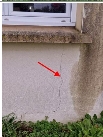
PHOTO N° PHTER003 LOCALISATION : ENDUIT MURS EXTÉRIEUR OUVRAGE : MURS EST.SUD.OUEST INFORMATIONS COMPLÉMENTAIRES : PRÉSENCE DE FISSURES SUR MURS ET ENDUITS EXTÉRIEUR