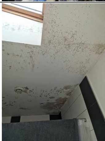
PHOTO N° PHTER002 LOCALISATION : SDE OUVRAGE : PLAFOND PARASITE : MOISSURES INFORMATIONS COMPLÉMENTAIRES : PROBLEME D'HUMIDITÉ SDE